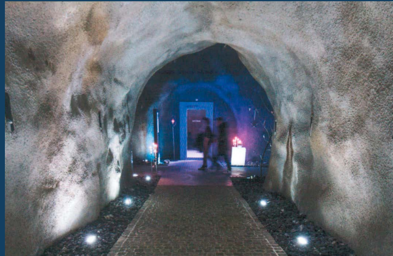
Der Eingang zum Restaurant Cantina Caverna.