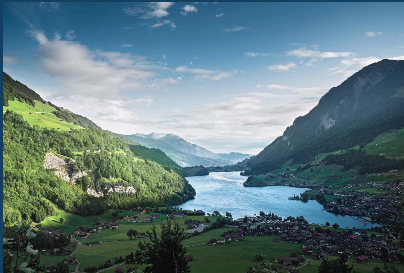
Blick vom Brünig auf den Lungernsee und die Gemeinde Lungern.

Neben dem Felsentresor bieten wir Ihnen im Aussenbereich Büroräume an.