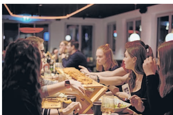
Neues, starkes Gruppenerlebnis.