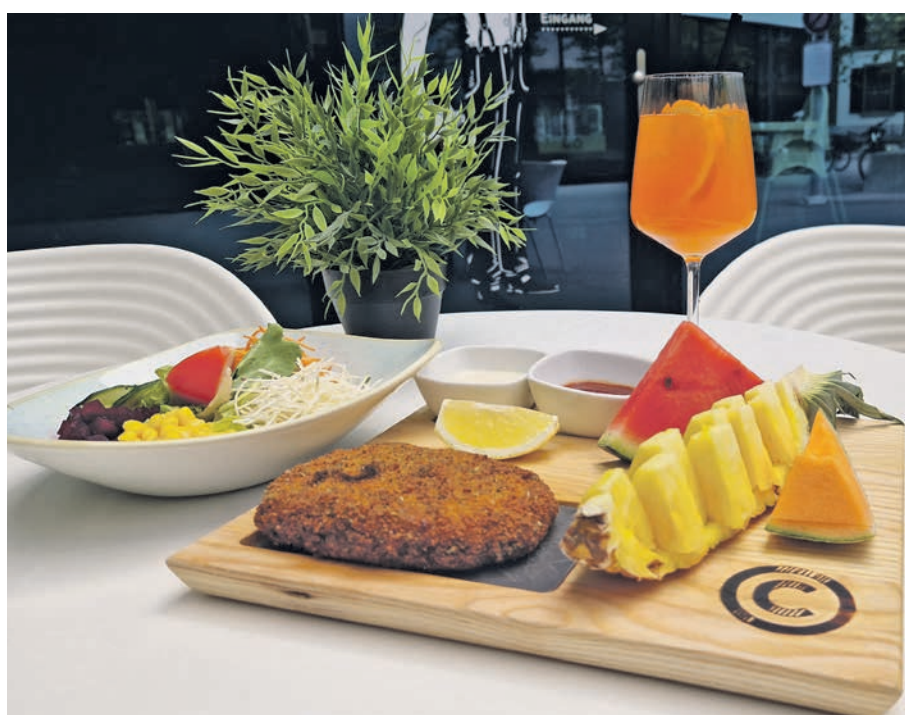
Jetzt sind im Mister Cordon in Thun die Sommer Specials angesagt.

Cordons Bleus sind auch im Sommer eine starke Nummer. Als Sommer Special gibt es jetzt einen knackigen Salat und verschiedene Früchte zum knusprig gold-gelb gebackenen Lieblings-Cordon-Bleu. Nach dem Anschneiden, fliesst einem der Käse cremig entgegen, derweil Ronaldo, Mbappé, De Jong und Co. kicken, was das Zeug hält – wenn die Liveübertragungen aller EM-Spiele im Mister Cordon Thun über die Mattscheibe flimmern. Der Sommer hält an dieser zentralen Thuner Ecke, Tür an Tür zum Kino, demnächst noch weitere Events bereit. So etwa Kinoabende in Zusammenarbeit