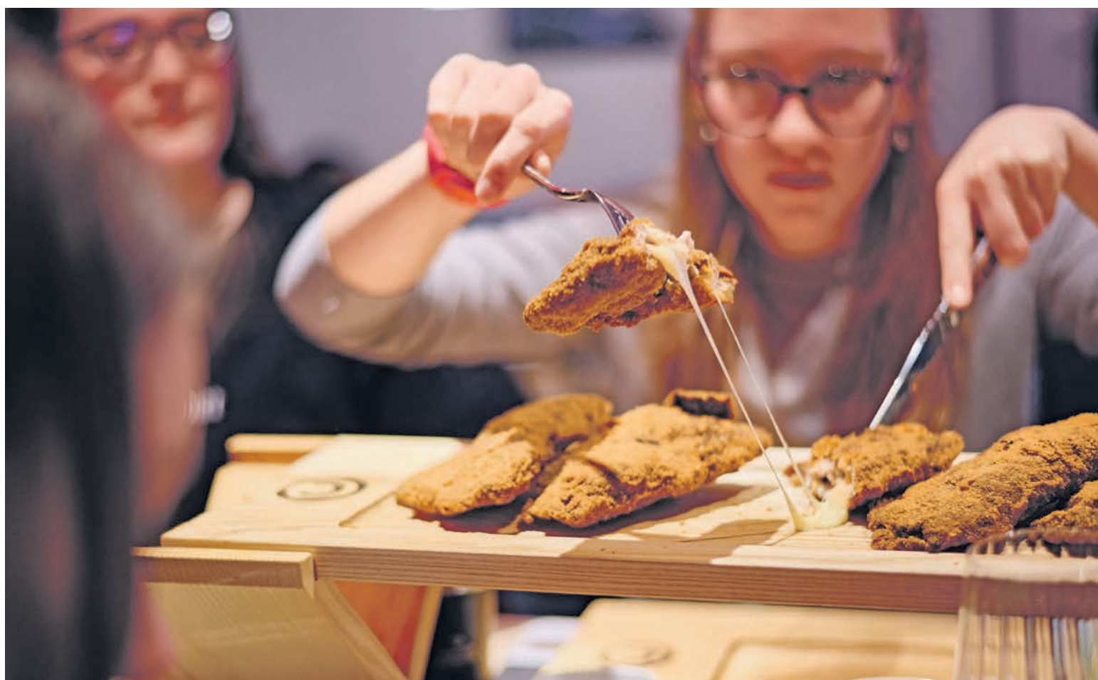
Cordons Bleus à go go – mit CH-Fleisch, vegetarisch, vegan, gluten- und laktosefrei.